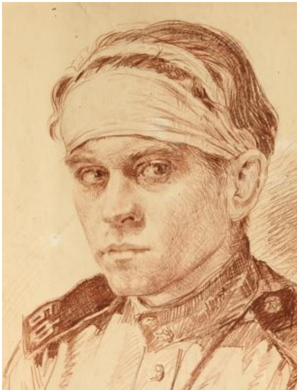
Афонин П.И., Раненый матрос, 1942г, бумага, карандаш. P.I.Afonin, Wounded sailor, 1944, pencil on paper.