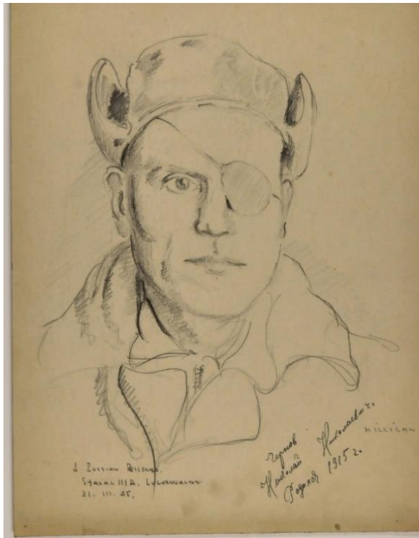
Миллиган, Э.А., Русский заключенный Сталаг IIIa, Чугунов Н.Н., 1945г, бумага, карандаш. E.A.Milligan, Russian Prisoner of Stalag IIIa, N.N. Chugunov, 1945, pencil on paper.