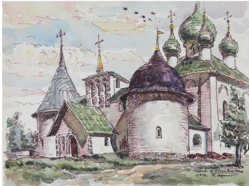
Афонин П.И., Церковь на Куликовом поле, 1979, фломастер, акварель. P.I.Afonin, Church on Kulikov Field, 1979, felt pen, watercolour on paper.