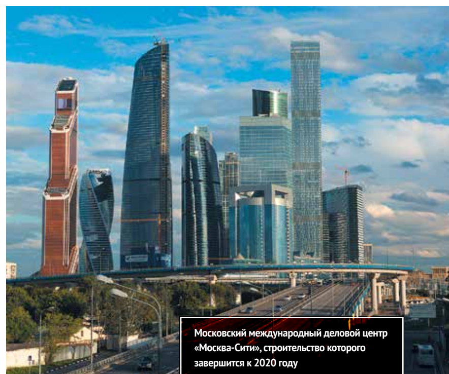
Московский международный деловой центр «Москва-Сити», строительство которого завершится к 2020 году