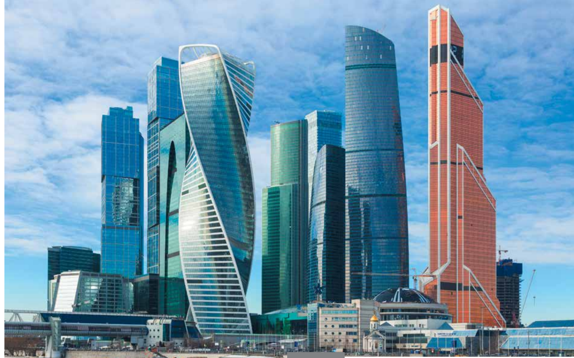
Вид на ММДЦ «Москва-Сити» со стороны Москвы-реки. Верхние этажи зданий занимают жилые апартаменты

По поводу сегодняшнего состояния проекта Московского международного делового центра «Москва-Сити» (кратко ММДЦ «Москва-Сити») можно сказать следующее: развитие проекта сильно затянулось. Если считать началом 1992 г., то уже прошло 26 лет. Из двадцати участков, входящих в комплекс, на четырех до сих пор продолжается строительство, один участок заморожен и еще два не начаты. Чем это вызвано? Частой сменой инвесторов. В результате проекты, а порой и уже построенные здания переделяются, отходят от общей композиции в ущерб всему комплексу. Обидно, что некоторые действительно уникальные решения не доведены до конца. Я говорю о едином под всем комплексом (площадью 20 га) общественном пространстве, объединяющем все здания ММДЦ «Москва-Сити», три станции метро, МЦК (Московское центральное кольцо), МЖД. По подземному переходу «Северный проезд» можно попасть в жилой район «Камушки», а по мосту «Багратион» – на Кутузовский проспект. Все передвижения осуществляются, не выходя на улицу! Кроме того, нами запроек-